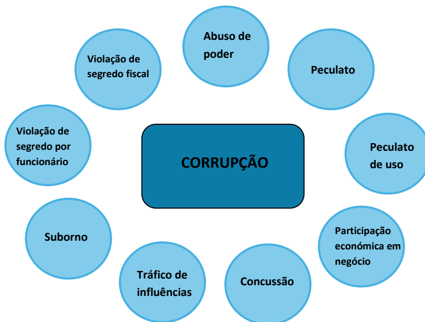
Figura 1 – Corrupção e Infrações Conexas

Assim, no PGRIC da AT-RAM tem-se presente a prevenção de riscos dos seguintes tipos de crimes: